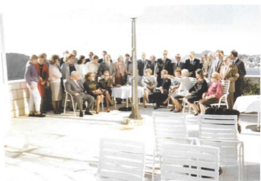
Prvi službeni sastanak Lionisa u Hrvatskoj – Poslije osnivačke skupštine LC Sv. Vlaho u dubrovačkom hotelu „Belvedere“, 20. listopada 1990. godine