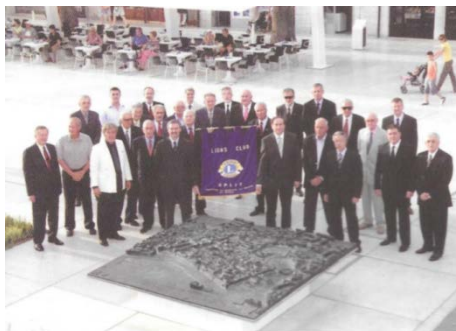
Članovi Lions kluba Split ispred brončane makete užeg središta grada Splita, koju su splitski Lionisi darovali svome gradu